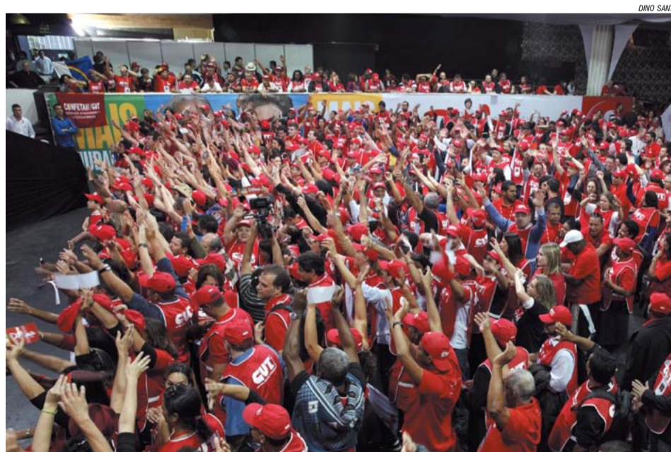
Delegados cutistas durante ato com a presidenta