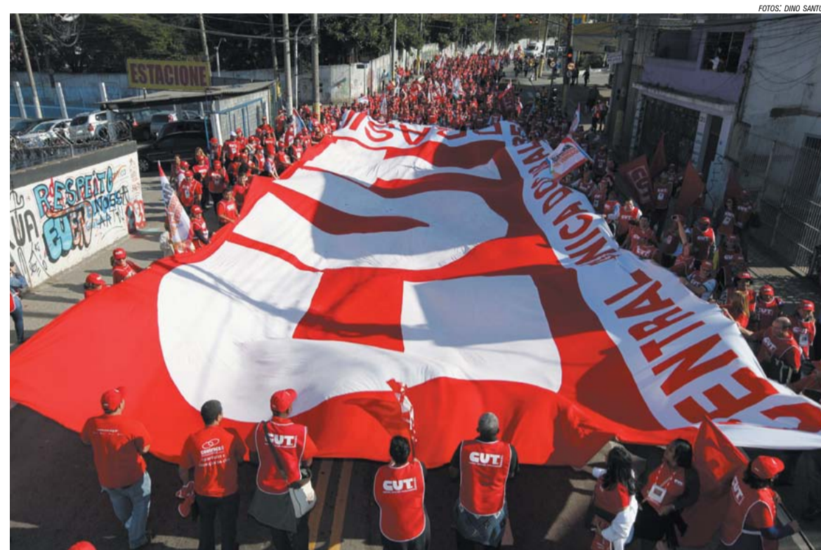
Trabalhadores deixam a Plenária e seguem em direção ao ato com a presidenta Dilma

“Não fui eleita nem serei reeleita para reduzir salário de trabalhador nem para colocar nosso País de joelhos diante de quem quer que seja”, destacou a presidenta. “Eu jamais traio os meus compromissos”, prosseguiu.